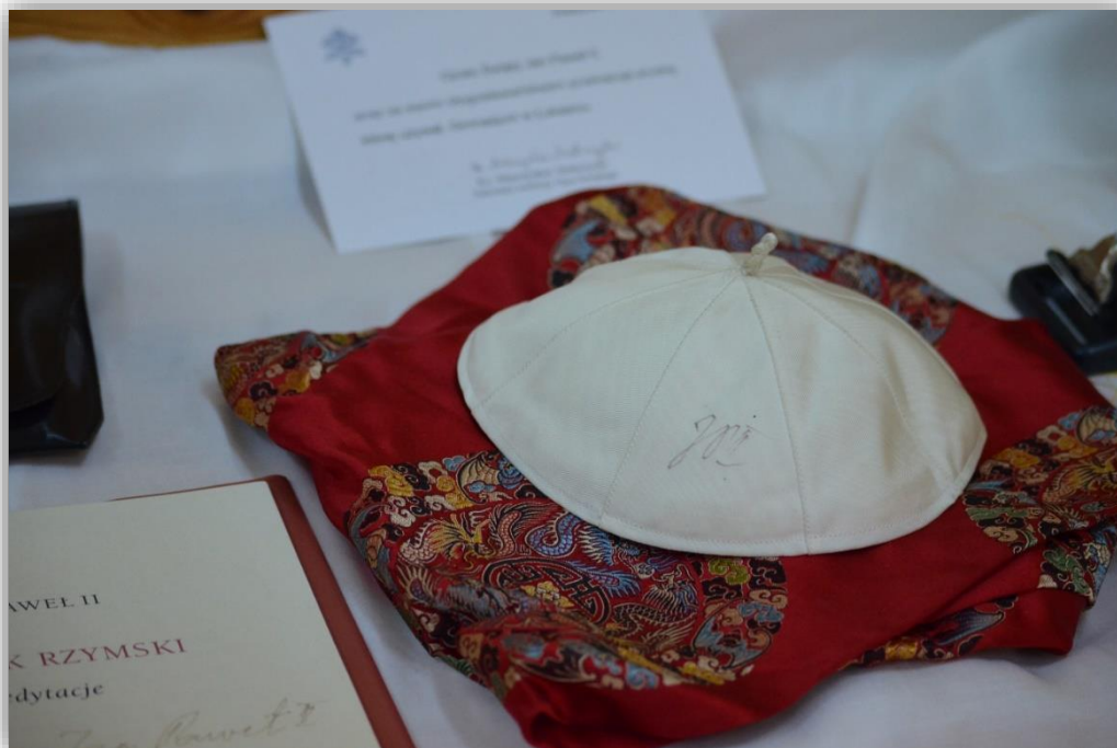
Rysunek 6 Piuska papieża Jana Pawła II znajdująca się w Izbie Pamięci

nauczanie naszego papieża wśród nich można wyróżnić m.in.: watykańskie wydanie „Tryptyku Rzymskiego” jak i „Rodzinę szkół im. Jana Pawła II” - gdzie zostało wymienione Gimnazjum w Łukawcu. Całą wystawę wzbogaca okazała kolekcja znaczków i kart pocztowych z wizerunkiem Jana Pawła II, makieta placu św. Piotra, pamiątkowe zdjęcia, mapa z zaznaczonymi miejscami, w których bywał Ojciec Święty oraz eksponaty, które otrzymał z egzotycznych krajów.