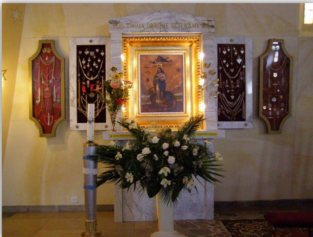
Rysunek 4 Obraz Matki Boskiej Niepokalanie Poczętej

Po przeciwnej stronie drogi w latach 1983-1989 wybudowano ogromny murowany kościół pw. Królowej Polski. W ołtarzy głównym znajduje się cudowny obraz Matki Boskiej Niepokalanie Poczętej pochodzący z Tartakowa, namalowany na początku XVII w. W Łukawcu jest on od 1965 r., koronowany przez Jana Pawła II dnia 3 czerwca 1991 r. w Lubaczowie. W kościele usytuowana jest też kaplica poświęcona pamięci świętego Jana Pawła II, w której znajdują się relikwie papieża Polaka.