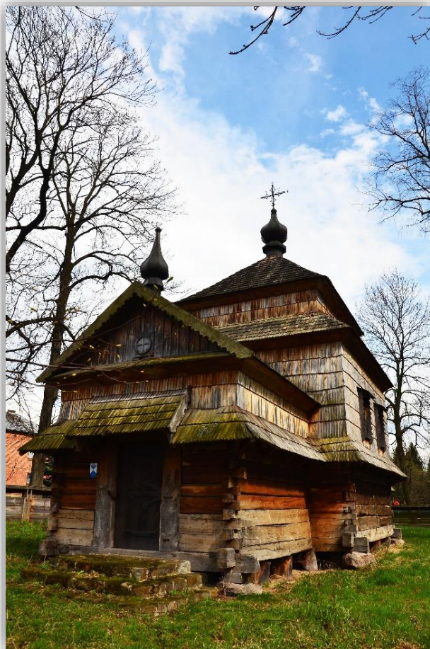
Rysunek 5 Cerkiew pw. Św. Dymitra Męczennika

Obiektem zabytkowym świadczącym o wielokulturowości jest położona w centrum wsi cerkiew greckokatolicka z 1701 r. pw. św. Dymitra Męczennika. Remontowana w 1753 r. rozbudowana w 1923 r., spalona w latach 80-tych, odremontowana w latach 1992-1996 z inicjatywy społecznej Komisji Opieki nad Zabytkami Sztuki Cerkiewnej w Warszawie. Obiekt należy do grupy tradycyjnych świątyń drewnianych Kościoła Wschodniego. Trójdzielny plan i jednokopułowa bryła nawiązuje do najstarszych cerkwi drewnianych z XVI/XVII w.