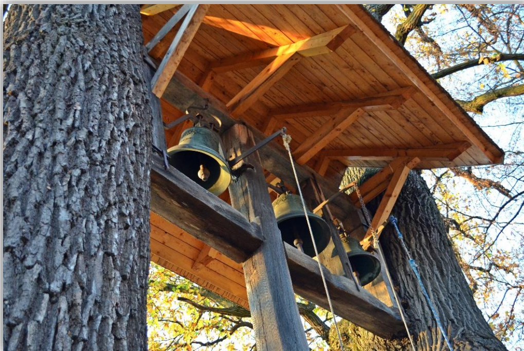
Rysunek 3 Zabytkowa dzwonnica przy kościele Trzech Króli

Po przeciwnej stronie drogi w latach 1983-1989 wybudowano ogromny murowany kościół pw. Królowej Polski. W ołtarzy głównym znajduje się cudowny obraz Matki Boskiej Niepokalanie Poczętej pochodzący z Tartakowa, namalowany na początku XVII w. W Łukawcu jest on od 1965 r., koronowany przez Jana Pawła II dnia 3 czerwca 1991 r. w Lubaczowie. W kościele usytuowana jest też kaplica poświęcona pamięci świętego Jana Pawła II, w której znajdują się relikwie papieża Polaka.