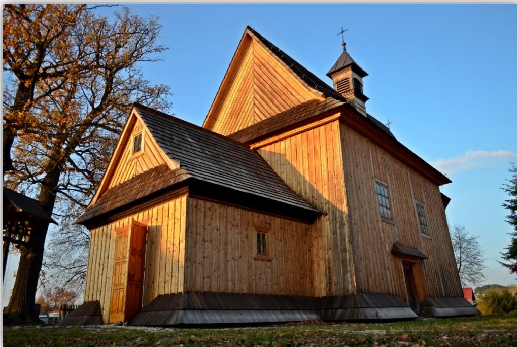
Rysunek 2 Kościół pw. Trzech Króli

Największym zabytkiem miejscowości jest piękny modrzewiowy kościółek pw. Trzech Króli z 1756 r., zbudowany na planie prostokąta, z trójbocznym prezbiterium, z przedsionkami i zakrystią od północy, z brusów modrzewiowych, wzmocniony dębowymi słupami, z dachem dwuspadowym krytym gontem, na szczycie sygnaturka z krzyżem. Na połączeniu nawy z prezbiterium umieszczona jest belka tęczowa z napisem w języku łacińskim z datą powstania kościoła i nazwiskiem fundatora. Otoczony jest wieńcem starych drzew, gdzie między dwoma dębami ustawiona jest dzwonnica z XVIII w., dęby jednocześnie stanowią część jej konstrukcji.