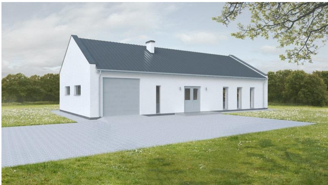
Makieta nowej świetlicy w Skolinie

Na terenie wsi znajduje się trawiaste boisko do gry w piłkę nożną, które ze względu na zły stan techniczny użytkowane jest w małym stopniu.